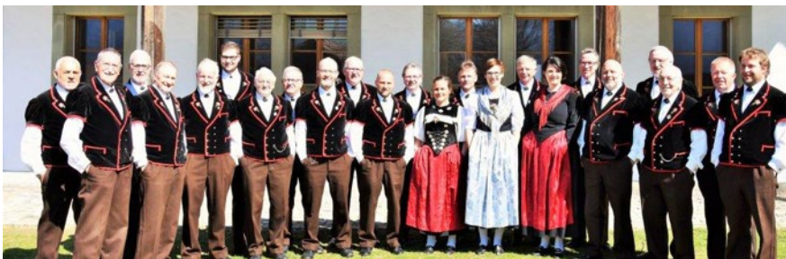
Jodlerclub Alpenrösli Münsingen